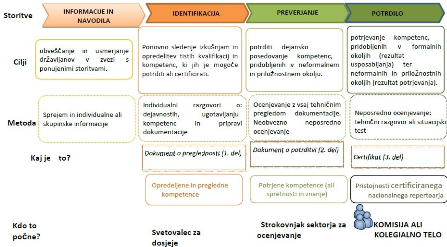
Slika 10.2 Povzetek standarda v skladu z DI z dne 30. junija 2015 o nacionalnem ogrodju regionalnih kvalifikacij