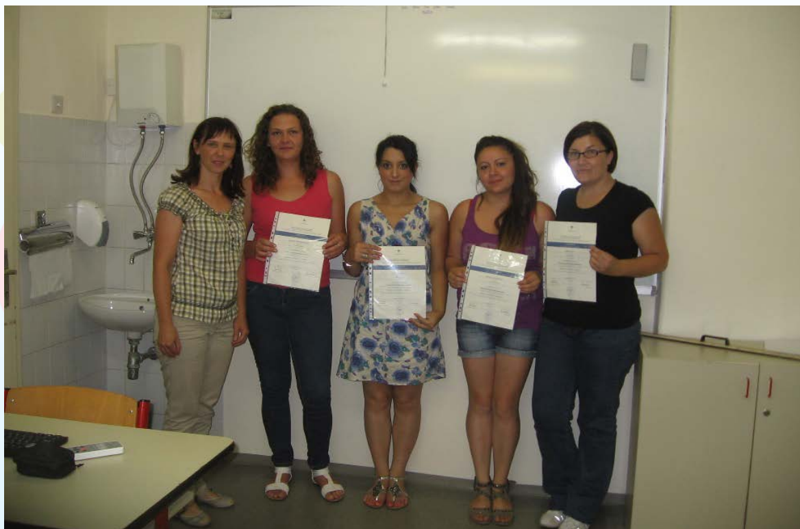
Prva skupina romskih pomočnic, leto 2013