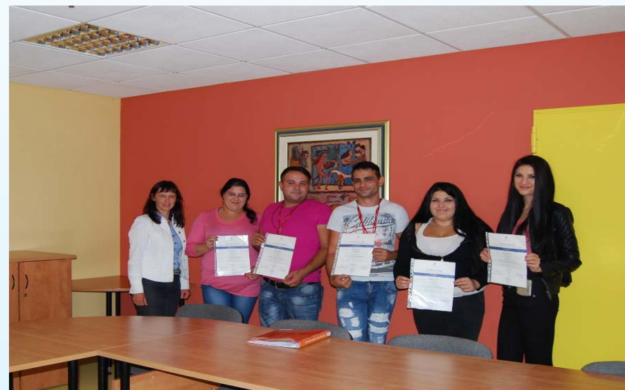
Romski koordinatorji v Novem mestu, leto 2015