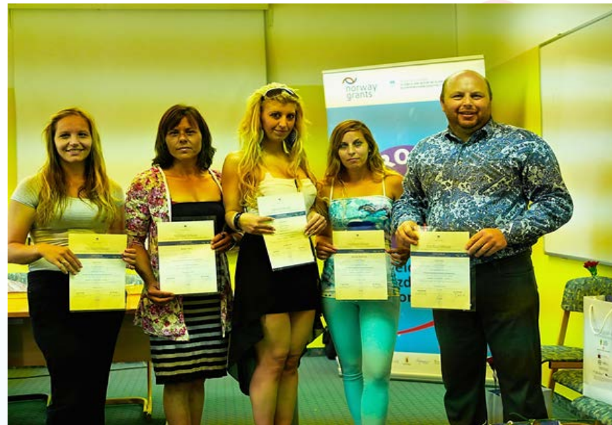
Prva skupina romskih koordinatorjev v Kočevju, leto 2015