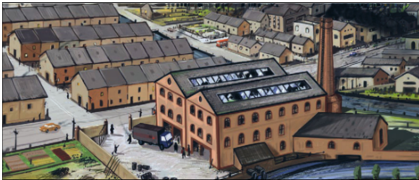
Egy ipari városnegyed Angliában 1950-ben

(Vir: Senegačnik, J., in drugi, 2019: Obča geografija. Učbenik za 1. letnik gimnazij, str. 169. Modrijan izobraževanje. Ljubljana)