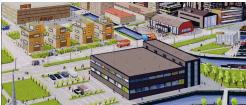
Egy ipari városnegyed Angliában 2020-ban