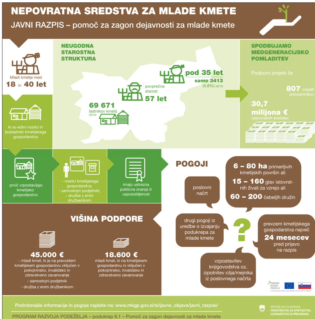
Slika 6: Nepovratna sredstva za mlade kmete

26. Pomagajte si s sliko 6 ter z opisom vzroka in posledice pojasnite pozitivni vpliv nepovratnih sredstev za mlade kmete, na razvoj podeželja v Sloveniji.