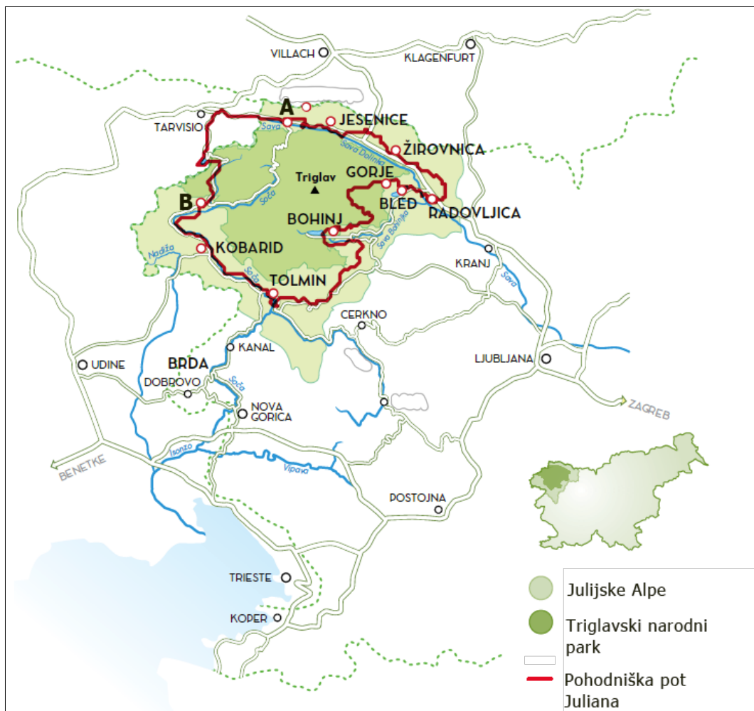
Slika 4: Pohodniška pot Juliana

11. Imenujte turistična kraja, ki sta na sliki 4 označena s črkama A in B.