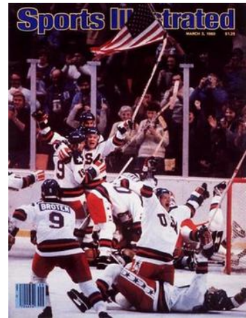
Slika 4: Čudež na ledu