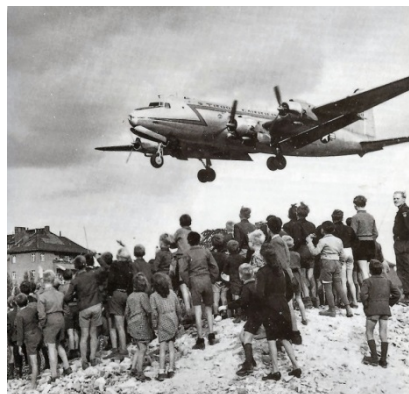
Slika 2: Berlinska blokada

17.1. Kaj je skušal Stalin doseči z blokado Berlina?