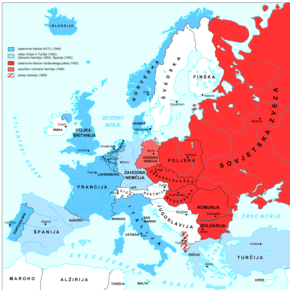
Slika 8: Evropske države po 2. svetovni vojni