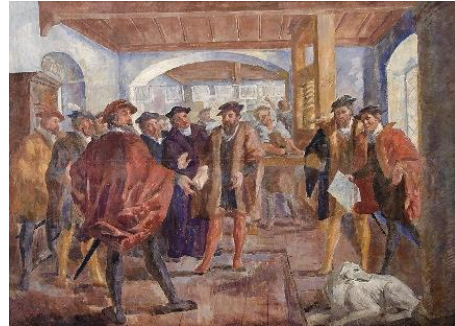
Slika 3: Tiskarna