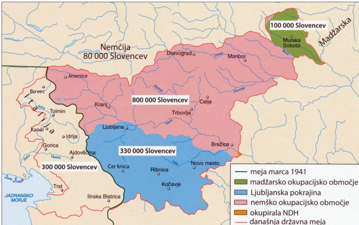
Slika 8: Okupacija slovenskega ozemlja

(Vir: Gabrič, A., Režek, M., 2011: Zgodovina 4, str. 159. DZS. Ljubljana)