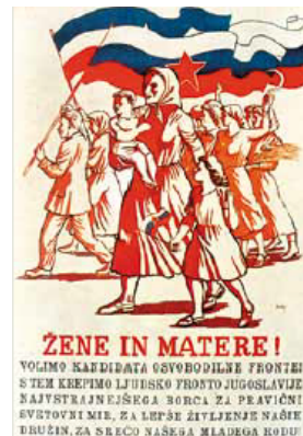
Slika 2: Volilna propaganda

Pojasnite, kako so potekale prve povojne svobodne volitve.