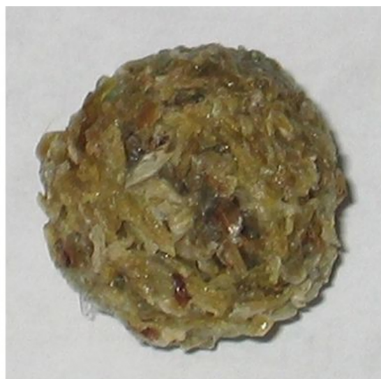
Slika 2 (slika 2 v barvni prilogi): James R. Ford, Bogey Ball , 2002–2004.