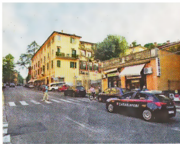
▲ Il quartiere sui colli Carabinieri in via San Mamolo

Nuovo scandalo dopo Villa Inferno Tutto è cominciato con la denuncia di una madre Nel giro almeno cinque studentesse