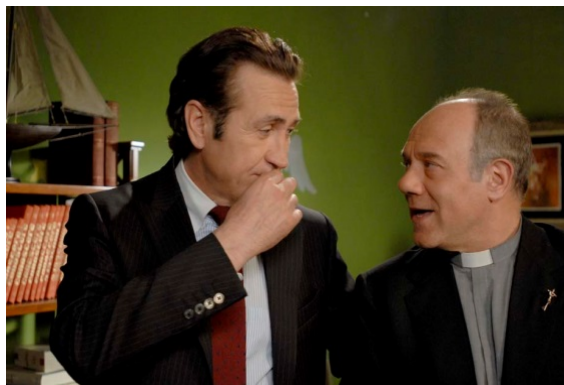
Marco Giallini (a sinistra) e Carlo Verdone (a destra)

Roma, una mattina di novembre. Ho un appuntamento con l'attore Marco Giallini. Lo raggiungo in taxi e lo trovo accerchiato dai fan: chi scatta selfie , chi chiede l'autografo. Marco, nato e cresciuto in una borgata della capitale, 'il Giallo' per gli amici, famiglia operaia, ha fatto una lunga gavetta in ruoli di secondo piano. È stato lanciato nel 2008 dalla serie tv Romanzo criminale ma è esploso negli ultimi anni grazie alle commedie di Carlo Verdone. E continua a lavorare senza sosta.