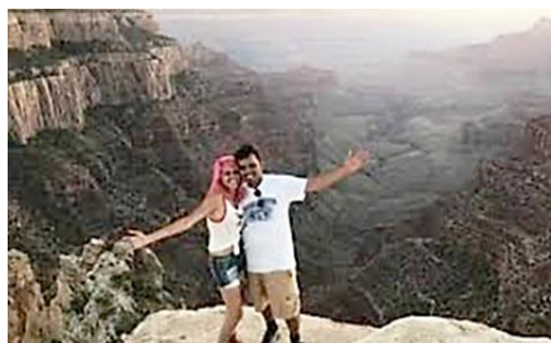
La coppia. Caduti in un burrone nel parco nazionale di Yosemite.

Una tragedia per una diffusa moda, che purtroppo - nonostante i tanti avvertimenti delle forze dell'ordine - continua a imperversare.