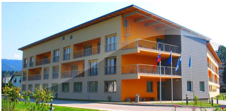
Koroški dom starostnikov, PE SG